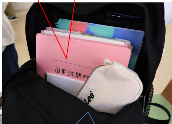
よく整理されていますね～ 荷物が多いので、リュック率が高いです。