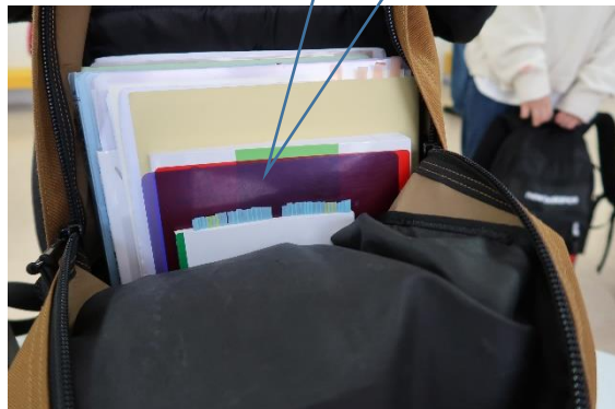
国試対策に取り組んでいることが わかってー安心！！