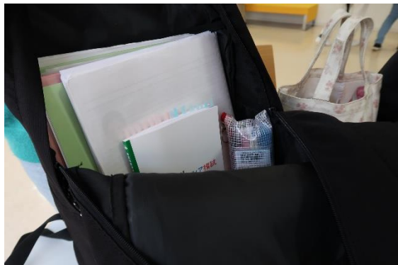
硬派な男子学生のリュック